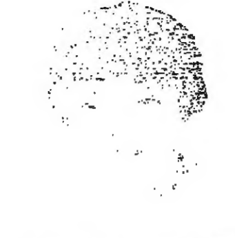
عادل تها اشقر